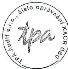
TPA Audit s.r.o. Antala Staška 2027/79, Praha 4 číslo oprávnění 080 KAČR